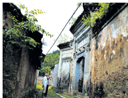
▲張氏宗祠是張氏兒女清明祭祀的重要場所。