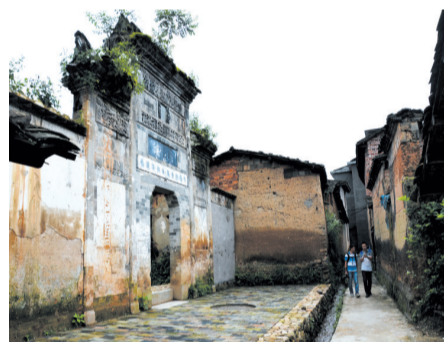
▲隨着古村落知名度的一步步提升，許多游客慕名前往。